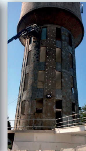
רח' סעחומה-מגדל המים