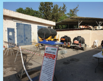
תחנה לחלוקה בחיפה

במהלך שנת 2019 התאגיד ביצע שיפורים נוספים בהערכות לחירום, השתתפות בתרגילים משותפים עם כל מכלולי העירייה, ותרגול תרחישי שונים של פגיעה ברשת המים והביוב.